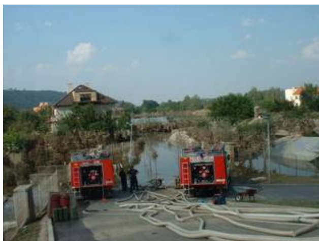
2002: Hilfseinsatz in Prag (Tschechische Republik)

Die Stadt Prag hatte große Probleme, die Hochwasserschäden des Moldauhochwassers vom August zu bewältigen und richtete einen Hilferuf ans europä-