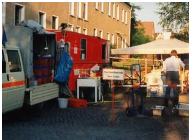
Gemeinsamer Küchenbetrieb von Berufsfeuerwehr und Maltesern vor dem Kinderheim Lennéstraße