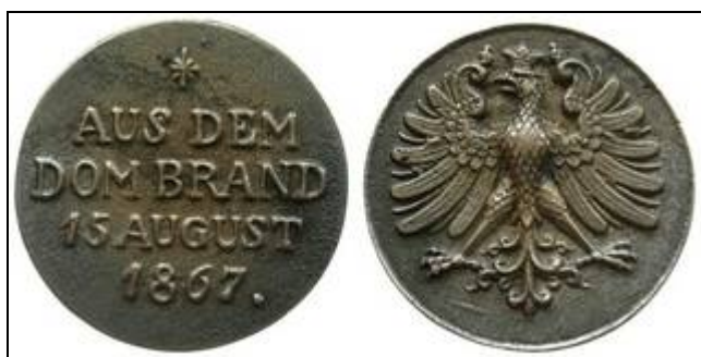
Bekannte Medaille aus unserem Museumsbestand

Für den Museumsbestand konnte der FGMV e.V. nun eine Gedenkmedaille erwerben (oben), die an den Brand des Frankfurter Doms am 15. August 1867 erinnert. Die Medaille wurde aus dem Metall der beim Brand zerstörten Glocken gegossen und an die Bevölkerung verkauft, um Gelder für den Wiederaufbau zu sammeln. Diese Gedenkmedaille ist in Sammler- und Historikerkreisen allgemein bekannt und befindet sich neuerdings auch im Bestand des Museums der Frankfurter Feuerwehr.