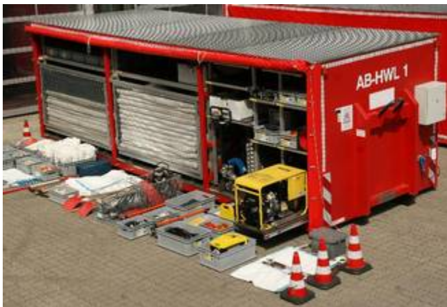
Einer von zwei AB-Hochwasserlogistik

Seit dem Jahr 2008 besitzt die Branddirektion zwei baugleiche AB-Hochwasserlogistik, die mit Geräten und Ausrüstungen für den Hochwassereinsatz ausgestattet sind. Hierzu gehören u.a. das Quickdamm-System, PVC-Folien mit Schneidemaschine, Tauchpumpen, faltbehälter, Generator, Beleuchtungsgerät und allerlei Zubehör. Eingesetzt werden die Abrollbehälter durch die Fachgruppe Wasser, die von der Freiwilligen Feuerwehr Frankfurt-Rödelheim und dem THW Frankfurt gemeinsam gebildet wird.