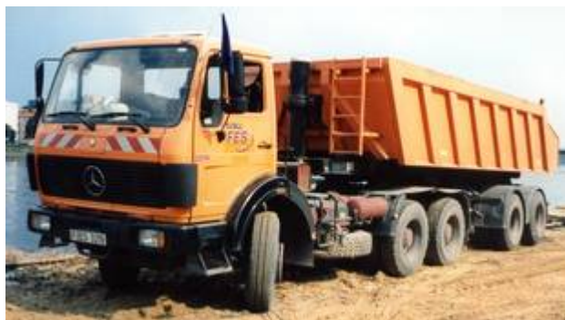
Kipper-Sattelzug der FES