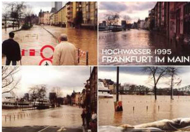
Auch das Hochwasser 1995 wurde auf einer Postkarte vermarktet...

Feuerwehr muss fünf „Wildwasser-Taucher“ aus der Strömung fischen. Die Männer hatten den reißenden Fluss mit einem Kanu bezwingen wollen und waren gekentert.