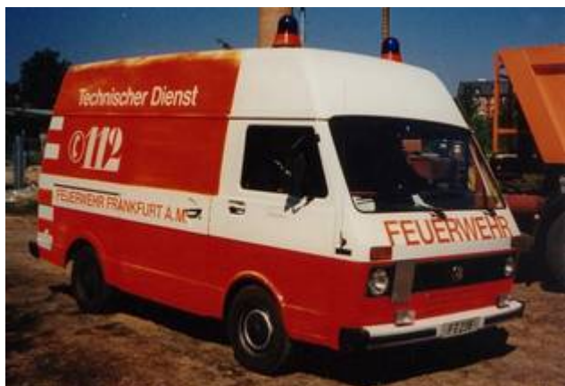
Enorm wichtiges Fahrzeug: Der Werkstattwagen