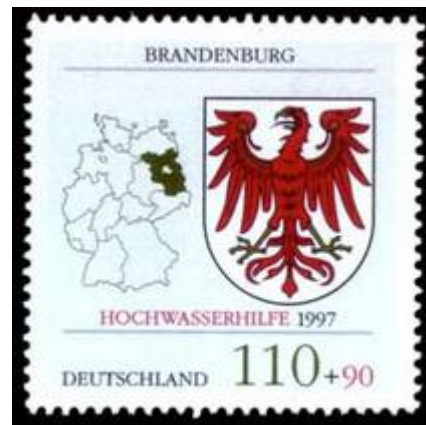
Sonderbriefmarke der Deutschen Post zum Oderhochwasser

und zu mit seinem Mercedes G-Modell, um den Fortgang der Arbeiten zu überwachen. Seitdem er mit seiner Forderung, alle Sandsäcke einzeln auszusütten, um Säcke und Sand getrennt zu deponieren, einen Streit über die Sinnlosigkeit eines solchen zusätzlichen Arbeitsaufwandes hervorgerufen und standhaften Widerstand geerntet hatte, war er dann aber auch nicht mehr gesehen.