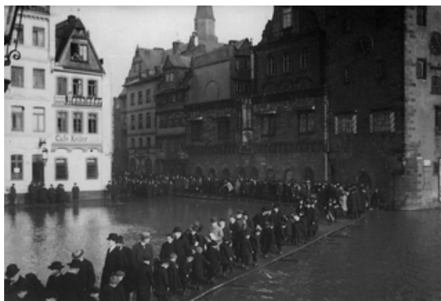
Hochwasser von 1909 am Mainkai (Postkarte)

Nach der großen Flut von 1882 werden Wehre und Schleusen gebaut. Trotzdem wird die Stadt auch weiterhin fast jedes Jahr mit leichten und mittleren Hochwassern konfrontiert, die in der Regel glimpflich und nur mit leichten Schäden ablaufen. Immer wieder mal treten dann aber auch noch schwere Überschwemmungen auf, die der Stadt, insbesondere der Altstadt, allerhand abverlangen.