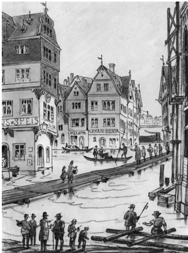
Hochwasser 1876 in der Frankfurter Altstadt

Hochwasser sucht die Stadt noch öfter heim. Im Januar 1633 sind erneut einige Todesfälle zu beklagen. Glimpflicher laufen die extremen Hochwasser der Jahre 1795 und 1845 ab, die dennoch enormen Schaden anrichten.