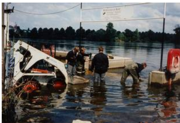
Erste Einsätze an und in stinkender Brühe...

Mit dem Abladen und dem Herstellen der Einsatzbereitschaft geht der Vormittag vorüber. Fast alle unsere Schritte werden bereits von Reportern begleitet; Kameras sind allgegenwärtig. In unmittelbarer Nähe unseres „Aufmarschgebietes“ steht eine ganze Wagenburg von Übertragungswagen aller möglichen in- und ausländischer Fernsehsender.