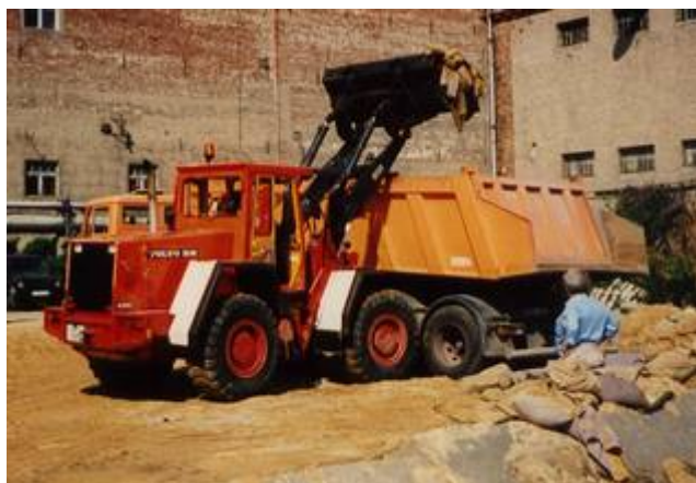
Radlader belädt FES-Sattelzug

Wir schwören uns, dass uns das nicht noch einmal passiert. Am Abend, als die Deponie bereits offiziell geschlossen hat (für die Katastrophenhelfer bleibt das Tor auf), üben wir auf dem Gelände das rückwärts fahren, bis es sitzt. Danach fahren wir den Sattelzug auch rückwärts um Ecken herum in die engsten Winkel und bekommen so langsam Spaß daran, das größte Fahrzeug des Hilfskonvois zu fahren.