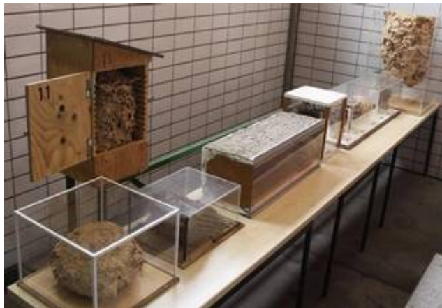
Schaustücke der ehemaligen „Via Vespa“

Druckluftwerkzeuge, ein Tauchertelefon, Schlauchboot und eine Schleifkorbtrage bleiben der Nachwelt erhalten.