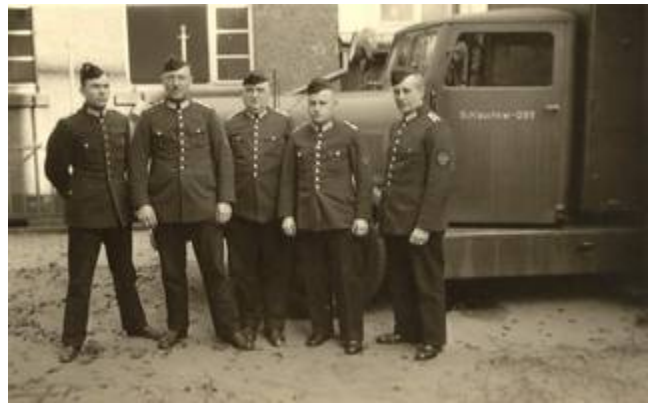
Frankfurter Feuerwehrmänner vor Schlauchkraftwagen in den frühen vierziger Jahren

In der letzten Ausgabe der „Museums-Depesche“ hatten wir angekündigt, für ein Sonderheft „Feuerwehr Frankfurt 1933 – 1945“ Material zu sammeln. Insbesondere die Freiwilligen Feuerwehren der Stadt (gern aber auch die Werkfeuerwehren!) sind dazu aufgerufen, nachzuschauen, was sie in ihren Archiven noch aus dieser Zeit finden (Fotos, Akten, Urkunden, usw.) und das Material der Museums-Depesche leihweise zur Verfügung zu stellen. Von einigen Stellen kamen zwar Absichtserklärungen, Material zur Verfügung zu stellen. Tatsächlich bei uns angekommen ist aber noch nichts, weswegen wir den Aufruf an dieser Stelle erneuern möchten!