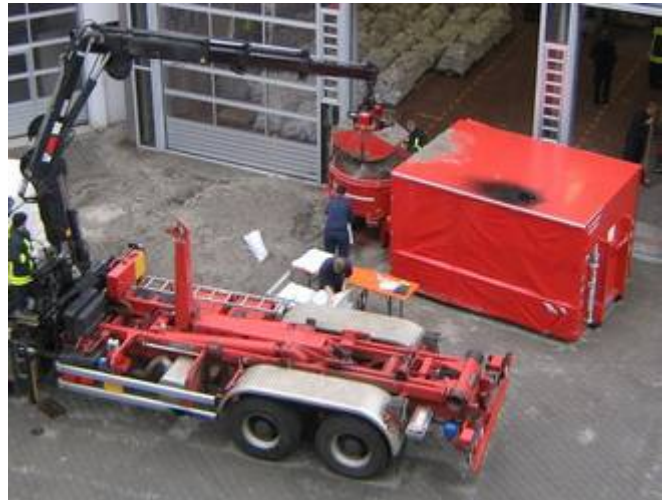
AB-Sandsackfüllmaschine im Einsatz

Im Jahr 2007 wurde für eine bereits vorhandene Sandsackfüllmaschine vom Typ König Power Sand-King ein Abrollbehälter beschafft, mit dem nun die Sandsackfüllmaschine, ein Generator und das erforderliche Zubehör transportiert werden können. Ideal ist das Zusammenspiel von Abrollbehälter und den Wechselladerfahrzeugen vom Typ Actros , da hier über den Ladekran die Maschine mit Sand bestückt werden kann (siehe Foto).