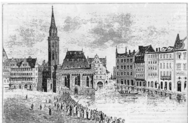
Das Hochwasser von 1882 am Römerberg

Soweit der Obermainkai reicht, der mit vollem Recht den Namen schöne Aussicht trägt, war das Frankfurter Ufer unzugänglich; der viel tiefere Mittelkai und Unterkai waren überschwemmt, und die zahllosen Zuschauer gelangten vom Innern der Stadt an den Römerberg und an das Leinwandhaus in der Umgebung des Kaiserdoms, wo sie den Stand der Hochflut am besten bemessen konnten. Man sah auf dem Römerberg, den Platz vor dem Rathaus zum Römer, daß die alte am Ufer gelegene Kaiserpfalz, der Saalhof, ganz vom Wasser umgeben war. Aber auch der nahe dem Saalhof gelegene, von dort bedeutend ansteigende Rathausplatz war nicht verschont geblieben, seine untere Hälfte stand überflutet.“