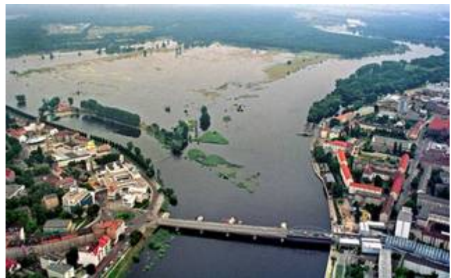
In Frankfurt/O. wird die Lage sehr kritisch...

Noch am gleichen Tag weichen die ersten Deiche auf. Der Wasserdruck beträgt sechs Tonnen pro Quadratmeter. Auf polnischer Seite bricht der Oderdeich auf einer Länge von 15 km insgesamt neunmal.