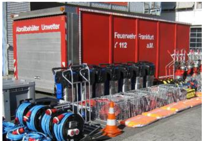
Pumpen, Industriesauger und Zubehör satt: AB-Unwetter

Ebenfalls seit dem Jahr 2008 verfügt die Branddirektion über einen Abrollbehälter „Unwetter“, der Gerätschaften und Zubehör zur Beseitigung großer bzw. zahlreicher Wasserschäden mitführt. Hierzu gehören je 4 Schmutzwasserpumpen vom Typ „Chiemsee“ und vom Typ „Grindex“, 13 Tauchpumpensätze, 7 Industriesauger, Sackkarren, Kabeltrommeln, Wathosen, Gummistiefel, Regenjacken, Gummischieber, Handleuchten u.v.m.