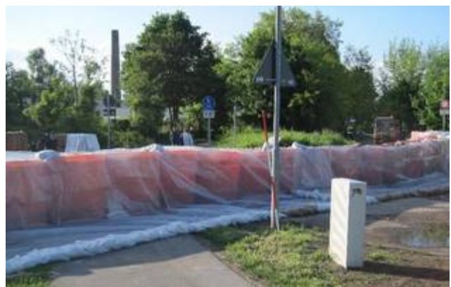
Aquariwa-Linie in der Nähe der Oder

Zu einem weiteren Hilfseinsatz, diesmal nicht zum Aufräumen, sondern im Vorfeld eines kommenden Hochwassers, kommt es in Frankfurt/O. Erstmals in Deutschland wird das Aquariwa-System als Hochwasserwall eingesetzt.