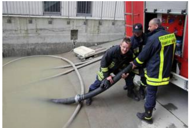
Hilfseinsatz in Krakau (Polen)

Am 20. Mai 2010 bittet die südpolnische Stadt Krakau ihre Partnerstadt Frankfurt am Main um technische Hilfe bei der Bewältigung von Hochwasserschäden. Noch in der Nacht werden zwei Fahrzeuge mit 40 Pumpen beladen und brechen mit 5 Mann Besatzung nach Krakau auf, wo sie nach 12 Stunden Fahrt ankommen. Drei Tage lang helfen die Frankfurter Kollegen beim Auspumpen zahlloser Keller in der Stadt.