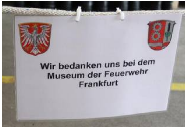
Artiger Dank der Dörnigheimer