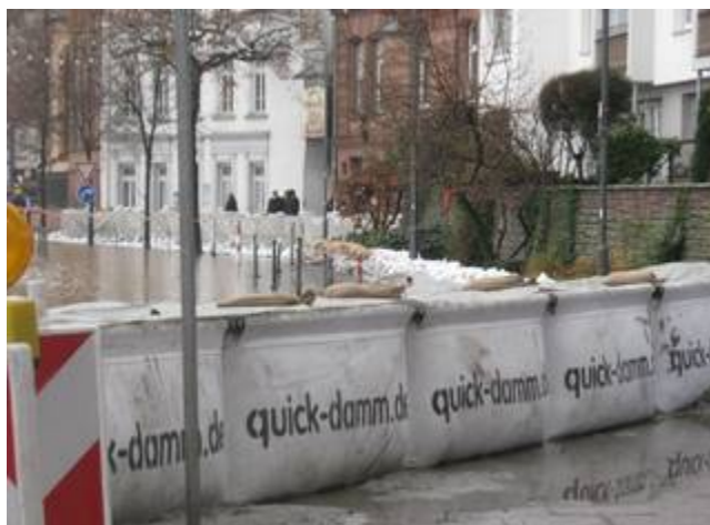
2011: Quickdamm-Linie im Bereich Leonhardstor

Auch in den kommenden Jahren gab es immer wieder Hochwasser am Main, die jedoch die Dramatik des Hochwassers von 1995 nicht mehr erreichten. Das bisher letzte Hochwasser im Januar 2011 kam dem dann aber schon wieder sehr nahe, traf aber nun auf eine bestens vorbereitete Feuerwehr, die aus dem Hochwasser von 1995 viel gelernt hatte. Außerdem steht heute eine wesentlich verbesserte Hochwasserlogistik z.T. auf Abrollbehältern, einsatzbereit zur Verfügung. Auch müssen nicht mehr ganz so viele Sandsäcke gefüllt und geschleppt werden, da nun Systeme wie Quickdamm und Aquariwa, mit denen in kurzer Zeit große Schutzwälle errichtet werden können, zur Verfügung.