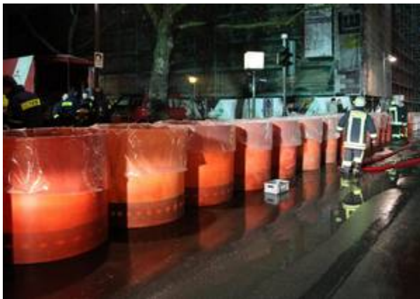
Aufbau der Aquariwa-Schutzlinie am Fahrtoer beim Main-Hochwasser im Januar 2011

Zum ersten deutschen Einsatz kam es 2010 in Frankfurt/Oder, wo die Überflutung einer breiten Durchfahrt zum Hafenbecken der Oder einen Stadtteil bedrohte. Das System wurde ohne Vorkenntnisse von der Feuerwehr und dem THW der Stadt in weniger als einer Stunde aufgebaut und mit dem Wasser der ansteigenden Oder gefüllt. Trotz ausbleibendem Hochwasser (oberhalb von Frankfurt brach auf polnischer Seite ein Deich), konnte das System seine unschlagbaren Vorteile unter Beweis stellen. Vor allem beeindruckte der schnelle Abbau, innerhalb von einer Stunde waren die Zylinderplatten wieder auf dem Lkw verladen, während die sandgefüllten Systeme noch mehrere Wochen herumlagen.