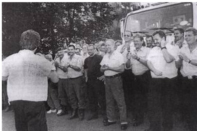
Spontaner Applaus für den Amtsleiter