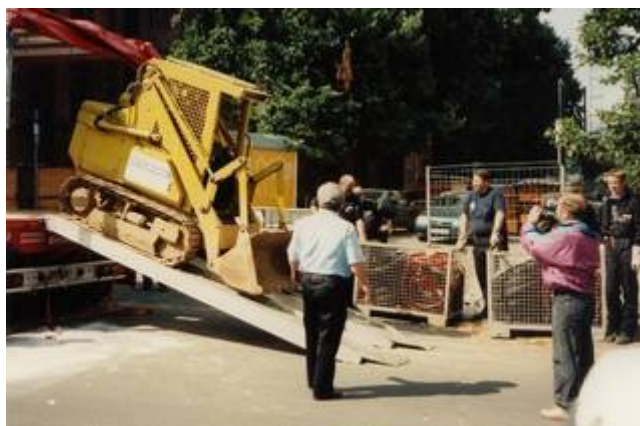
Die Frankfurter vom Main laden ihr Material aus – das Fernsehen ist schon dabei

Nach dem Frühstück erfolgt der erste Aufbruch in die Innenstadt von Frankfurt. Der Einsatzleitstellenanhänger (ELSA) muss aufgebaut und viel Material von den LKWs abgeladen werden. Die Stimmung der Kollegen bessert sich nun zunehmend mit dem guten Wetter und der Nachricht, dass die Feuerwehr im Laufe des Tages von der Messe in eine neue Unterkunft umziehen wird.