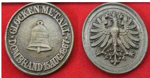
Bei ebay angebotene Medaille

Für den Museumsbestand konnte der FGMV e.V. nun eine Gedenkmedaille erwerben (oben), die an den Brand des Frankfurter Doms am 15. August 1867 erinnert. Die Medaille wurde aus dem Metall der beim Brand zerstörten Glocken gegossen und an die Bevölkerung verkauft, um Gelder für den Wiederaufbau zu sammeln. Diese Gedenkmedaille ist in Sammler- und Historikerkreisen allgemein bekannt und befindet sich neuerdings auch im Bestand des Museums der Frankfurter Feuerwehr.