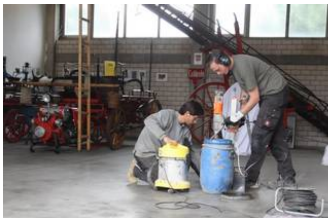
Kernbohrung in weitgehend freigeräumter Halle