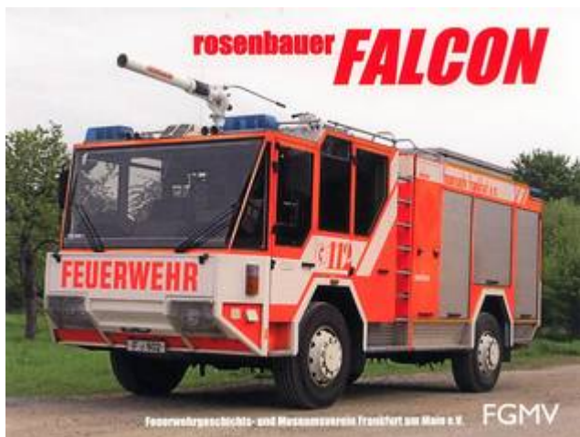
„Falcon“ - Postkarte

In zunächst kleiner Auflage ist die nunmehr fünfte Postkarte des Museums der Frankfurter Feuerwehr erschienen. Die Bildseite zeigt den Falcon im aktuellen Zustand, die Rückseite gibt einige Daten zum Fahrzeug an. Die Postkarte kann für einen Euro im Museumsshop erworben werden.