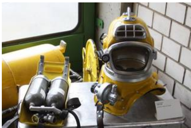
Helmtauchgerät Dräger DM 220

Ende Mai und Anfang Juni konnten viele Neuzugänge ins Museumsdepot verzeichnet werden. Besonders zahlreich kamen Gegenstände und Geräte aus dem Bereich der Wasserrettung. Ein ganzer Ständer mit verschiedenen Taucheranzügen sowie ein Dräger Helmtauchgerät samt Schlauchtrommeln,