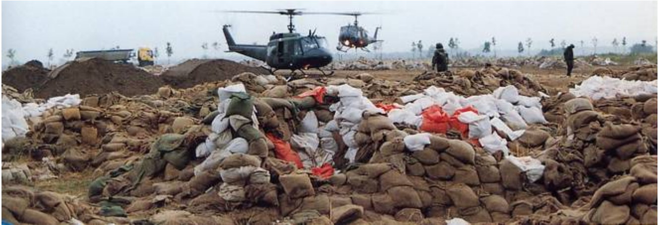
Kampf ums Oderbruch: Den absoluten Löwenanteil der Einsatzkräfte stellt die Bundeswehr

Sehr persönliche Eindrücke von der Hilfsaktion an der Oder im Jahr 1997