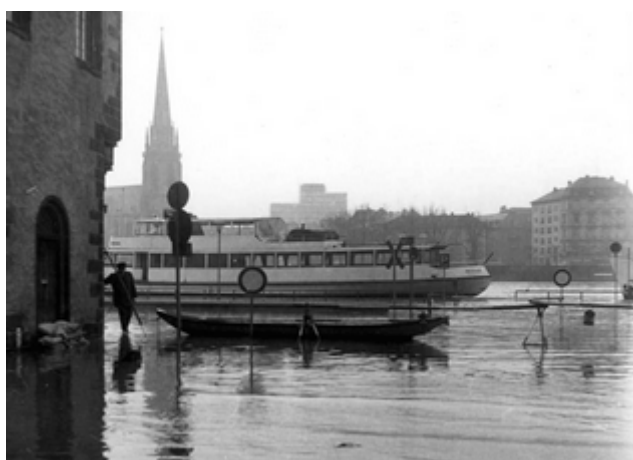
Hochwasser im Februar 1970

Anmerkung: Die Situationen dieser beiden Fotos mögen wie Anekdoten aus Uropas Tagen wirken. Tatsächlich hat sich bis zum heutigen Tagen nichts daran geändert. Auch das Katastrophen-Hochwasser aus dem Jahr 1995 wurde auf einer Postkarte vermarktet und auch beim letzten schlimmen Hochwasser im Januar 2011 musste die Feuerwehr rund um die Uhr ihre Dämme in der Altstadt überwachen, da wiederholt Schaulustige, oft angetrunkene Jugendliche, die Wälle erklommen; sei es, als Mutprobe oder einfach, um „die Aussicht zu genießen“. Hinzu kommt in der heutigen Zeit leider auch noch die ständige Angst vor der Beschädigung der Notdämme durch Vandalismus.