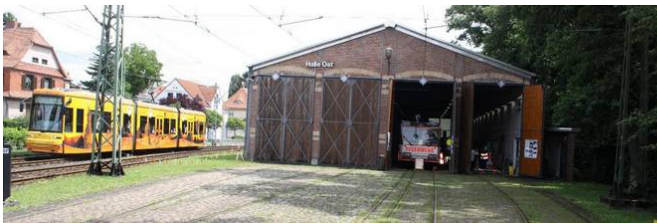
Ungewohnte Umgebung: „Falcon“ im Schwanheimer Verkehrsmuseum