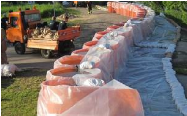
Frankfurt a.d. Oder im Jahr 2010

In Krakau wurden die Zylinder zum ersten Mal real eingesetzt. Ein Straßenzug wurde durch mit Sand gefüllte Zylinder gesichert. Die Zylinder standen absolut sicher, obwohl das Hochwasser mit mind. 1,40 m anstand.